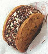
Ice cream sandwich $68 件