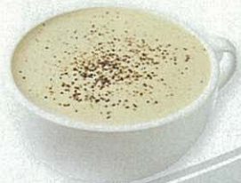
Chai latte $50