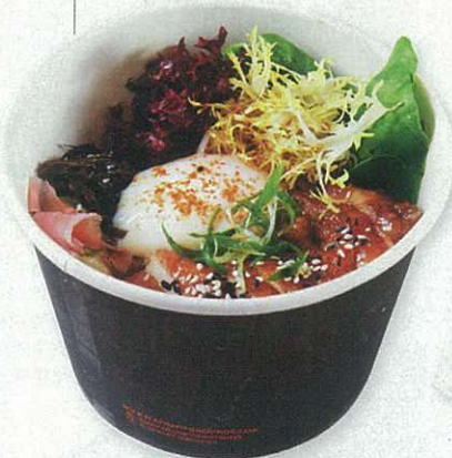
Roast chicken $75