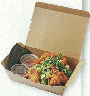
Fried chicken $78