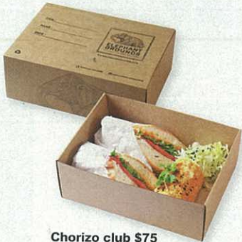
Chorizo club $75

幫襯當日，我仲知銅鑼灣店都開咗，收得晏啲，噍！咁以後係百德新街掃貨之後，夜啲都可以吃到肥妹必吃嘅 ice cream sandwiches 囉。👍